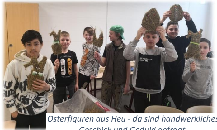
Osterfiguren aus Heu - da sind handwerkliches Geschick und Geduld gefragt.