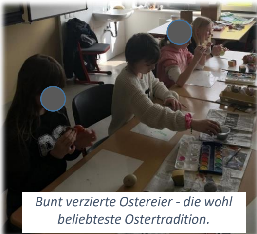
Bunt verzierte Ostereier - die wohl beliebteste Ostertradition.