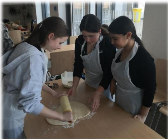
Den Hefeteig ausrollen, die Osterhäuschen ausstechen, backen und vernaschen.