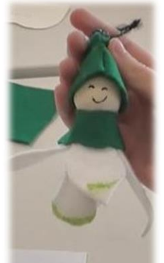
Ein fertiges Schneeglöckchen.

An verschiedenen Stationen im Schulhaus konnten die Mädchen und Jungen dekorativen Osterschmuck für zuhause basteln, Ostereier bunt färben, traditionelles Ostergebäck aus Hefe herstellen und natürlich verkosten sowie viel „Osterwissen“ über das beliebte Fest sammeln.