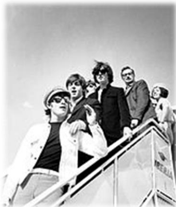
The Beatles 1965

Die Beatles stammen aus den Arbeitervierteln der an der englischen Küste gelegenen Hafenstadt Liverpool. 1960 traten sie (wegen ihrer Haartracht auch „Pilzköpfe“ genannt) erstmals auf. Mit mehr als 230 Liedern erwarben sie sich gemeinsam ein großes Vermögen. 1970 trennten sie sich.