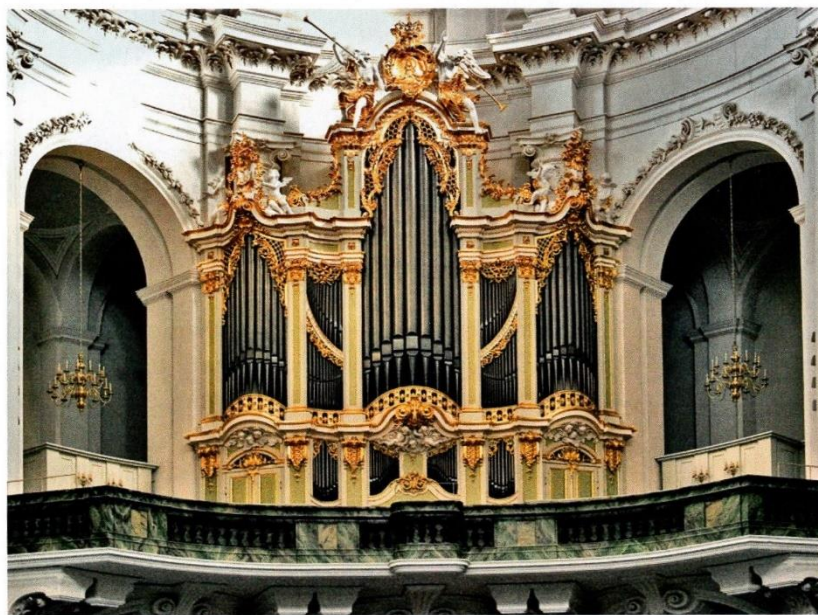
Silbermannorgel in der Dresdner Hofkirche

https://www.planet-schule.de/sf/multimedia/lernspiele/klangkiste_instrumentenquiz/mme/mmewin.html